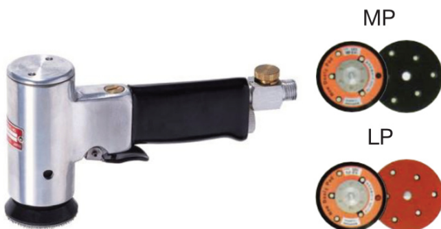
MINI D/A SANDER