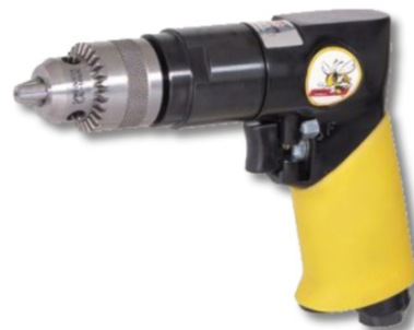
3/8" REVERSIBLE DRILL